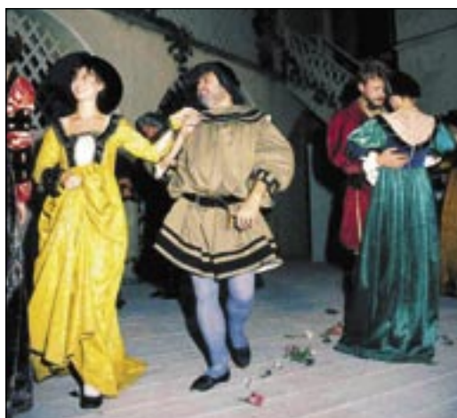
Oben: Burg Falkenstein. Unten: Further Drachenstich und mittelalterliches Spektakel auf Falkenstein.