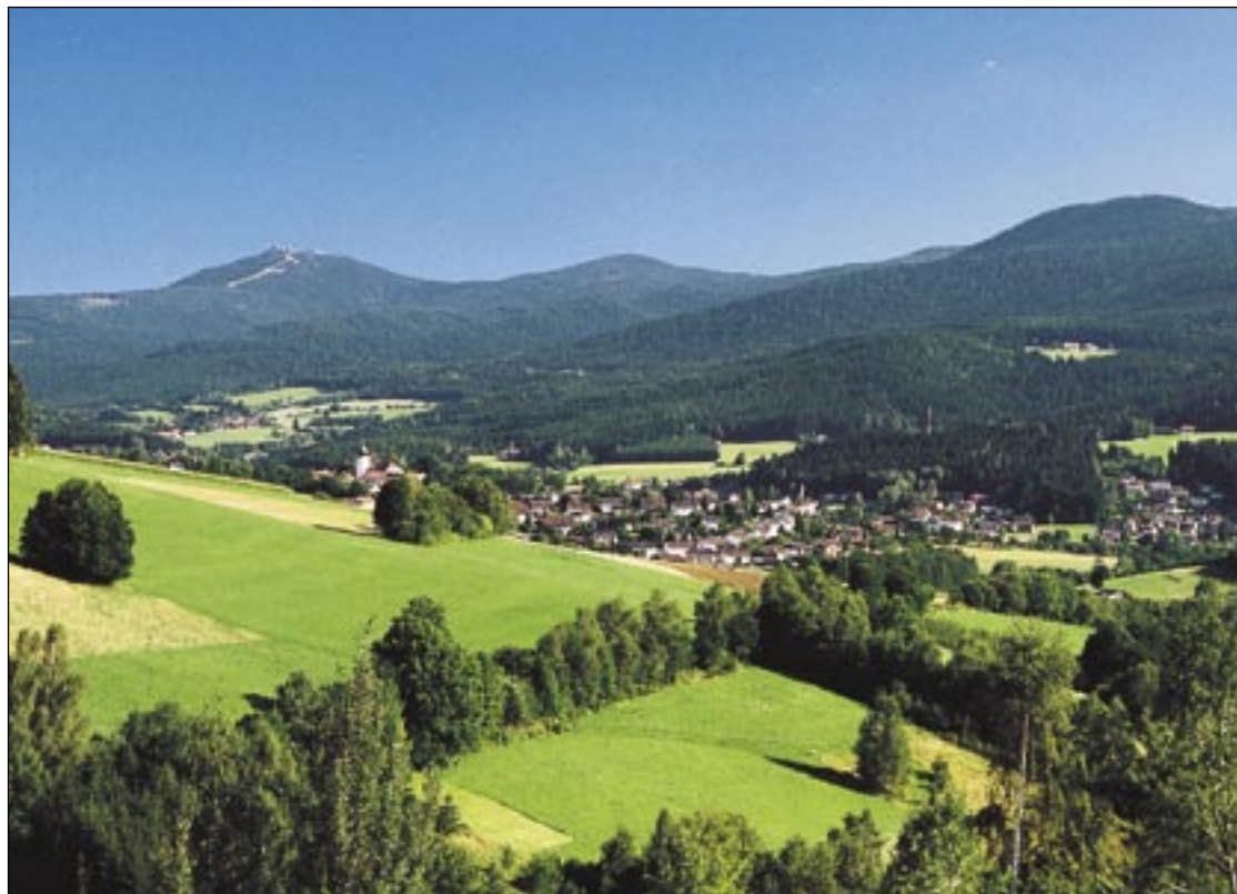
Links: Grenzbahnhof in Bayerisch-Eisenstein. Rechts: Lamer Winkel.

Die Weiterfahrt führt über einen kurvigen, unasphaltierten Singletrail talwärts – ein Genuss für den Cross-Country-Freak. Anschließend geht das Streckenprofil ausnahmsweise in eine Flachetappe über,