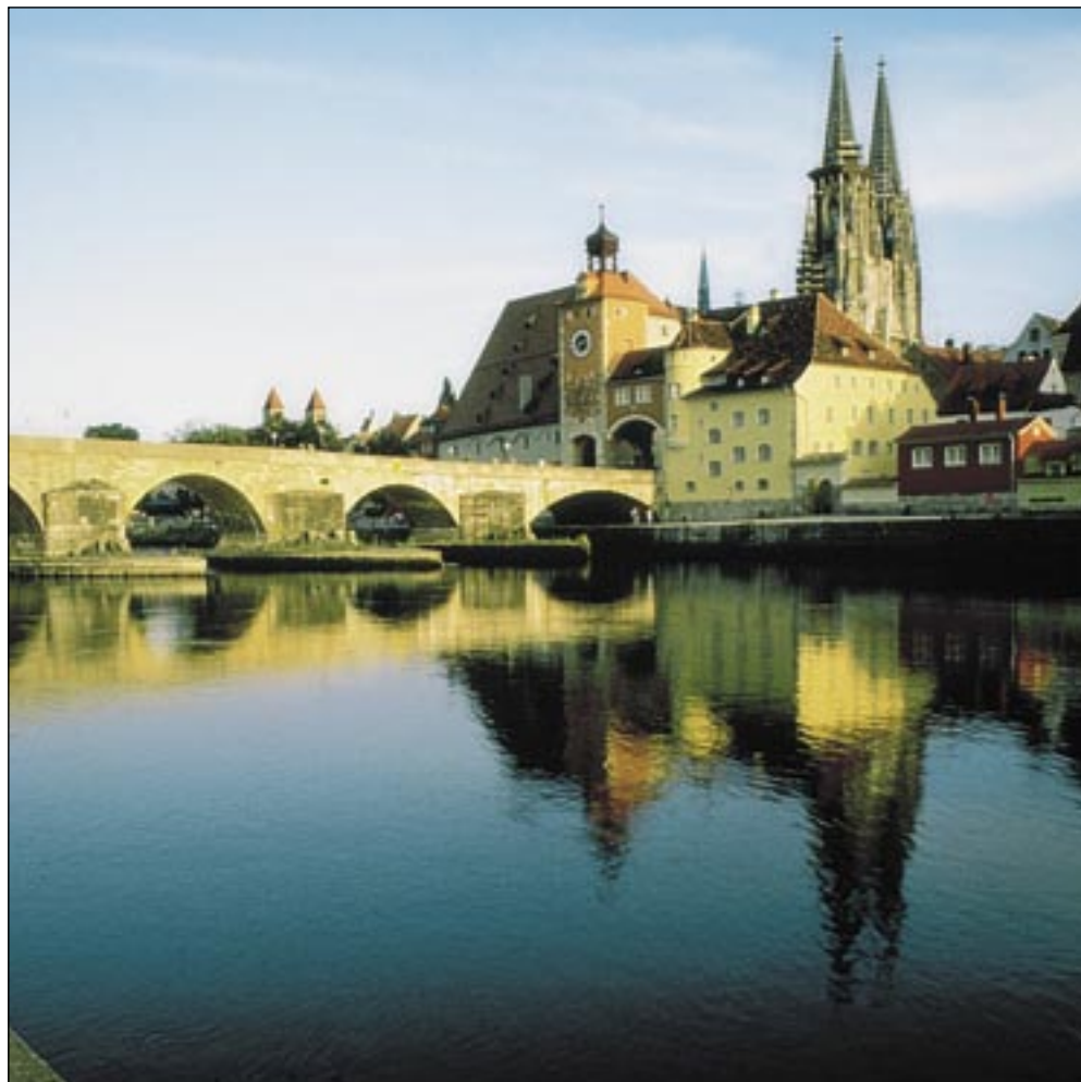
Oben: die Domstadt Regensburg. Rechts: Radler am Kleinen Arbersee.

Der Regental-Radweg ist eine durchgängig gut beschilderte und befahrbare Radwanderoute - größtenteils auf ausgebauten Radwegen oder auf verkehrsarmen Nebenstraßen mit vorzüglicher radtouristischer Infrastruktur. Der Radweg führt von der Quelle in der Nähe von Bayerisch-Eisenstein bis in die historische Stadt Regensburg und zur Mündung des Regens. Von der Vereinigung der „Zubrin-