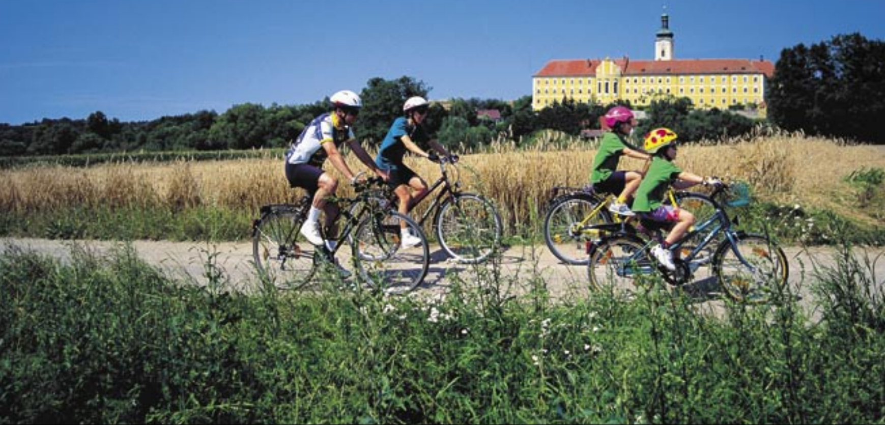
Ein Radl-Spaß für die ganze Familie: der Regentalradweg. Rechts: Kleiner Arbersee und Turm in Furth im Wald.