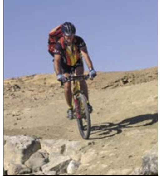
Auch sportliches Mountainbiken ist in Israel kein Problem. Strecken sind zuhauf vorhanden.