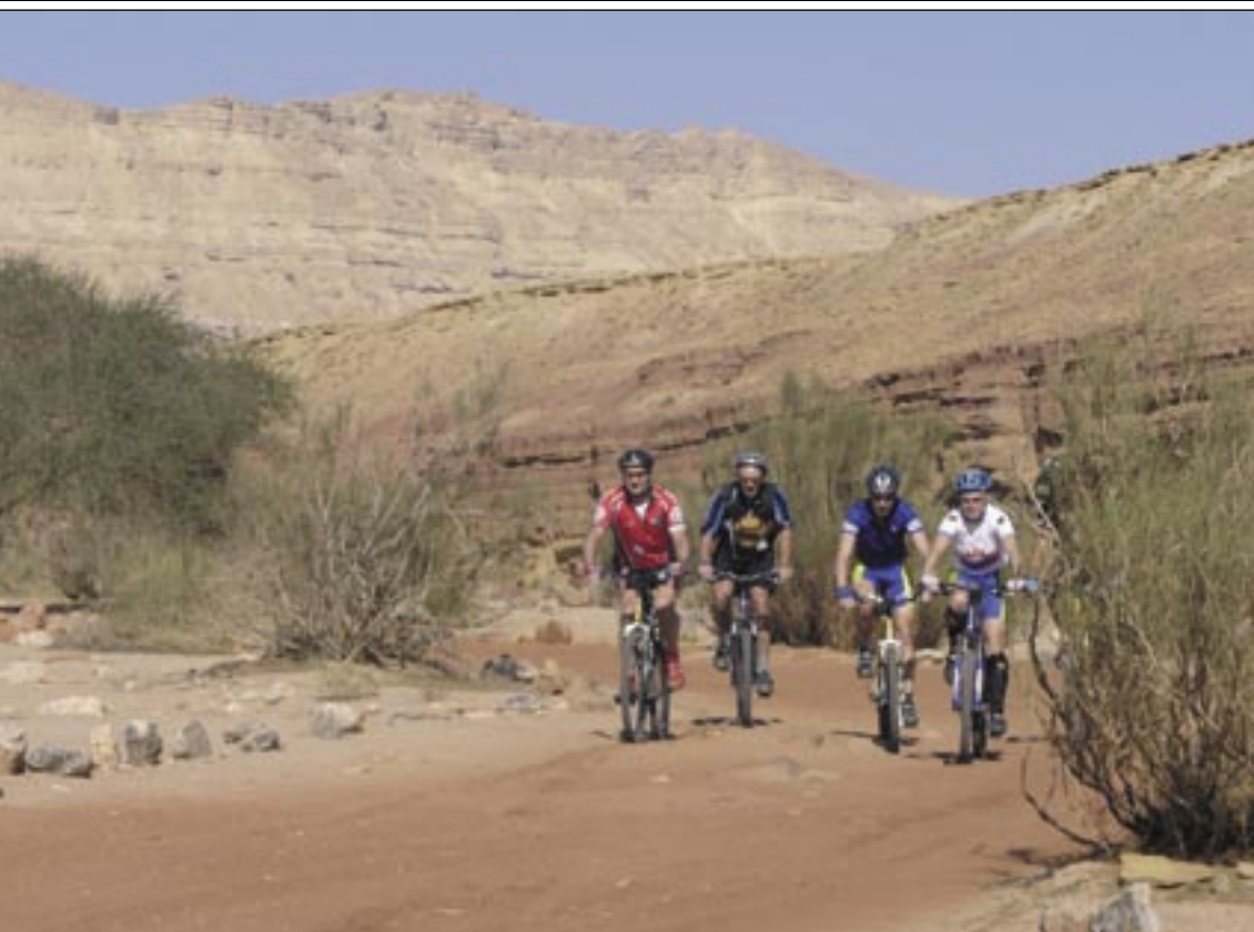
Oben: Grandioser Blick auf die heilige Stadt Jerusalem. Zahlreiche Bauten der religiösen Geschichte, wie der islamische Felsendom auf dem Tempelberg, zeugen von einer großartigen Kultur.