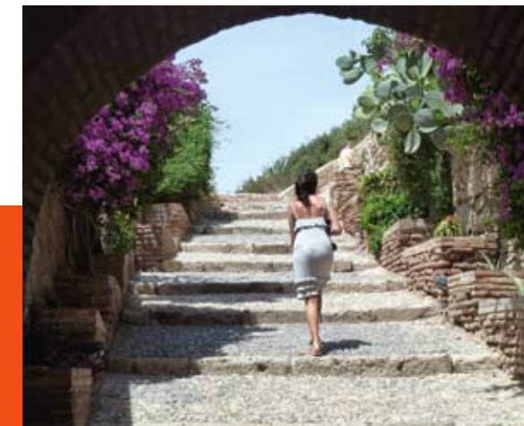
Andalusien lädt auch zu Ausflügen ohne Fahrrad ein. Viel Spaß dabei!