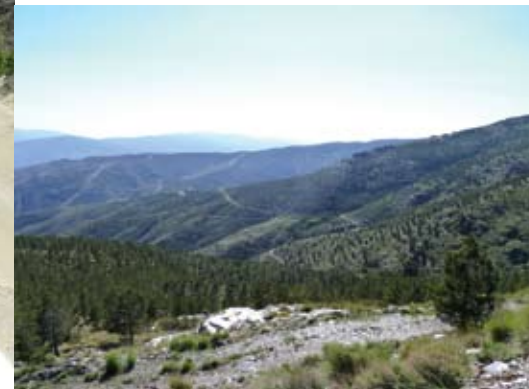
Links oben: Straßenbeschriftungen lupfen die Moral – da kommt Freude auf! Oben: Ab und an wird am fernen Horizont der Blick auf die zumeist schneebedeckte Sierra Nevada-Gipfelkette frei. Unten: dieses Foto bedarf wohl keiner Erklärung; ein Bild sagt mehr als tausend Worte....